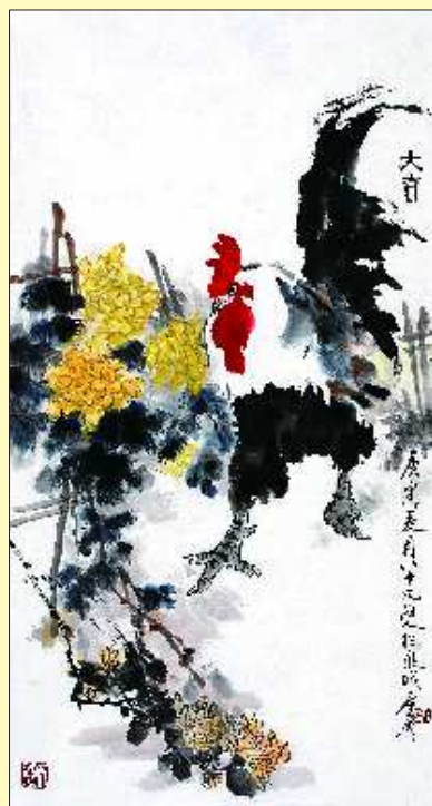
▲大吉 180cm X 97cm