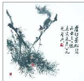
▲虚谷画松鼠 68cm X 68cm

●陈绥祥(中央美院研究员):“乍老给我们最大的启示，就是作为一个最普通的中国人，在当今时代如何把握我们民族自己的艺术。”