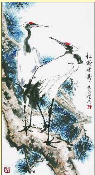
▲松龄鹤寿 180cm X 97cm