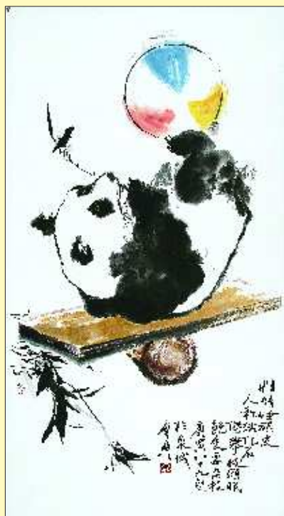
▲性情顽皮 180cm X 97cm

当今艺术市场上，乍启典先生的画作受众多收藏者的青睐，作品价格不断攀升。究其原因，是乍老的艺术成就、价值得到人们的广泛认可。纵观乍老近年的一批新作，题材广泛，根植自然，无不饱含画家积极向上的创作态度及对生活的热爱。同时，他是一位土生土长，师古人师造化的画家，虽未经专业艺术教育，却自有一套艺术创作的方法、体系，是一位在全省乃至全国都具有相当影响力的美术大家。