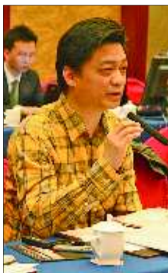
崔永元在分组讨论上发言。

任全国政协委员4年,在公众的关注下,崔永元坦言,当委员比当主持人还小心,一件事不彻底搞清楚不能开口,一张口那就是责任。