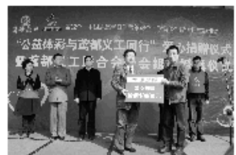
众民生、促进社会和谐发展做出了应有的贡献。(彩想飞扬)

多年来,体彩以造福社会、服务市民为己任,处处彰显公益本色,体彩筹集的公益金除支持奥运争光和全民健身计划实施外,还广泛用于国家社会保障基金、城镇和农村医疗救助、青少年校外活动场所建设和维护、红十字人道主义救助、残疾人事业等社会公益事业中,除此之外,体彩还广泛开展爱心捐赠、义卖救助、体质监测等多种形式的社会公益活动,为服务大