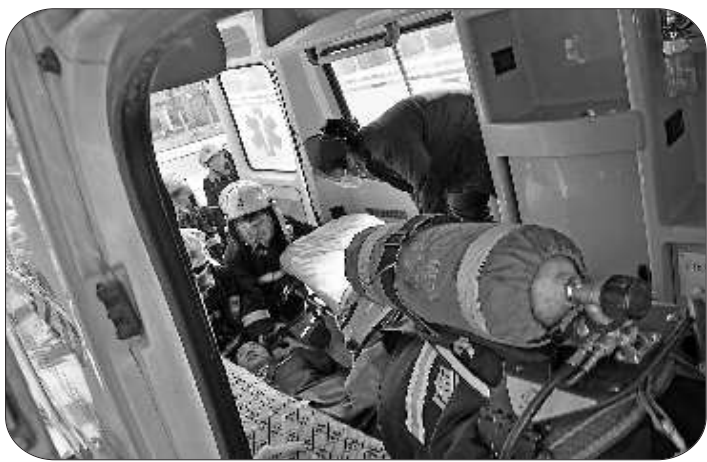
120救护车与消防人员联动,救助伤员。