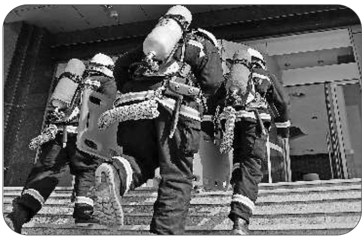
全副武装的消防官兵迅速进入火场展开救援。