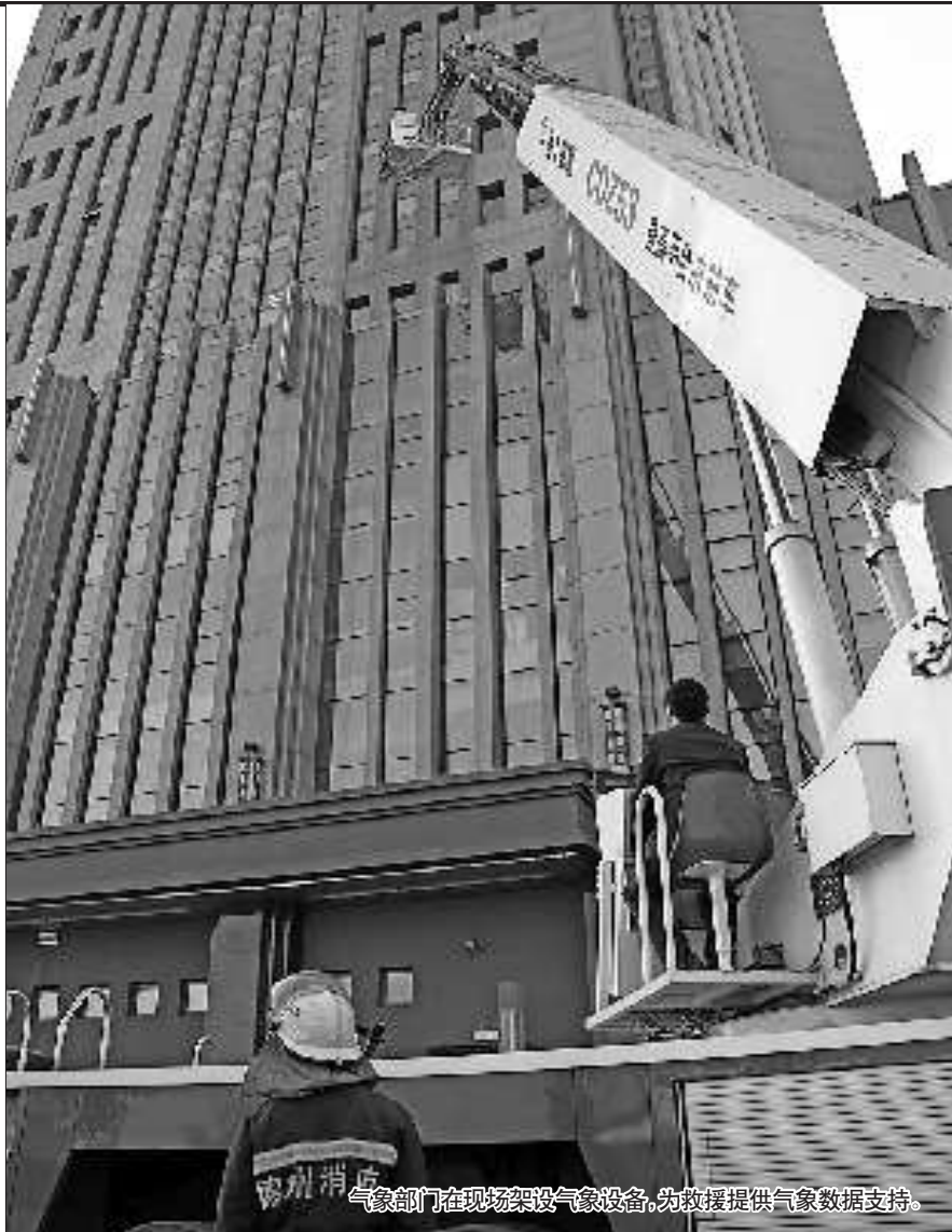
气象部门在现场架设气象设备,为救援提供气象数据支持。