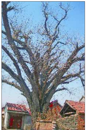
莒县棋山镇庞庄村千年银杏树。