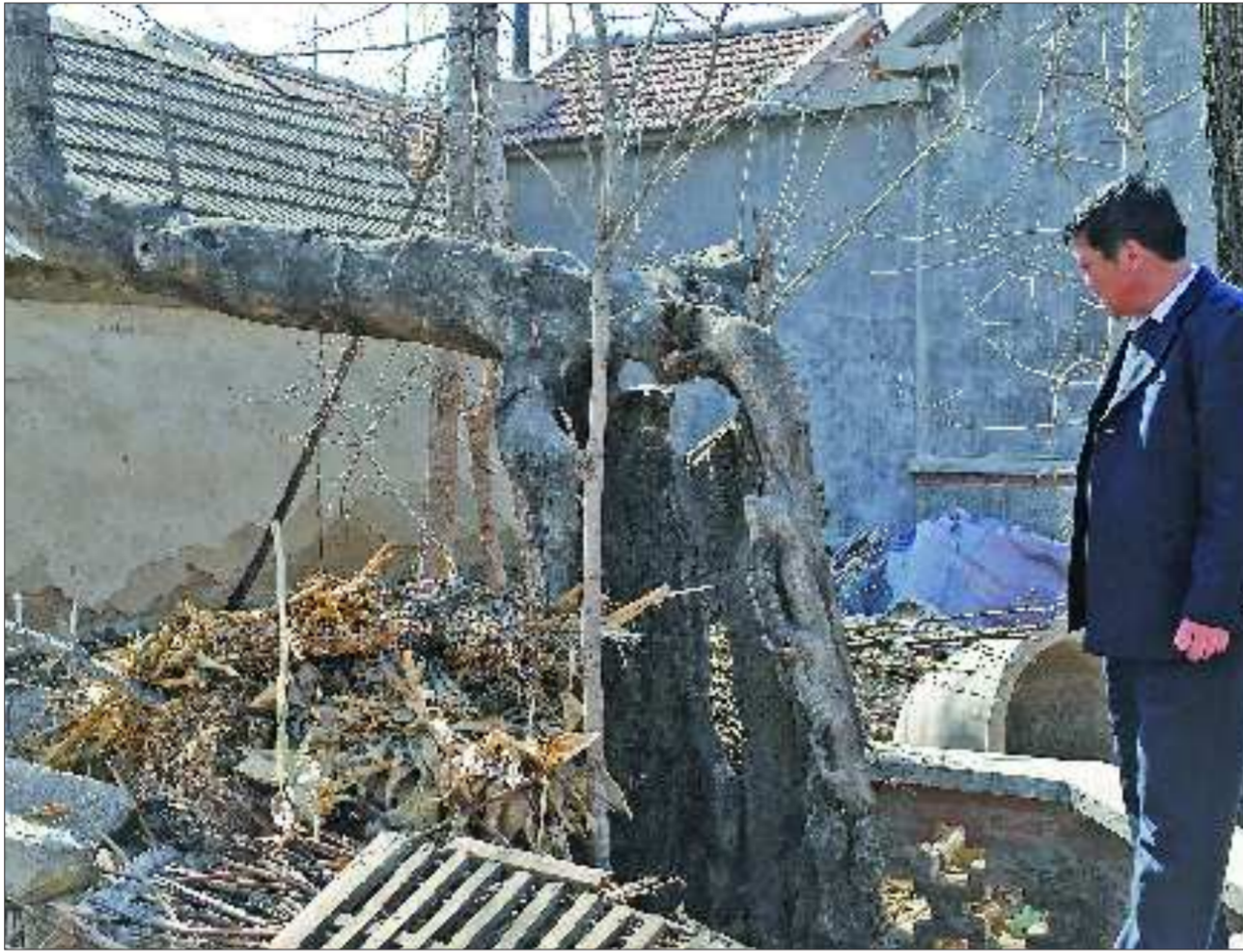
莒县浮来镇十里堡的千年国槐已经枯死,林业工作人员感到很遗憾。