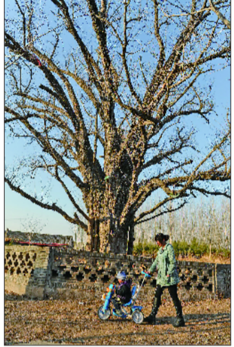
大花崖村,古银杏成为村民的好邻居。