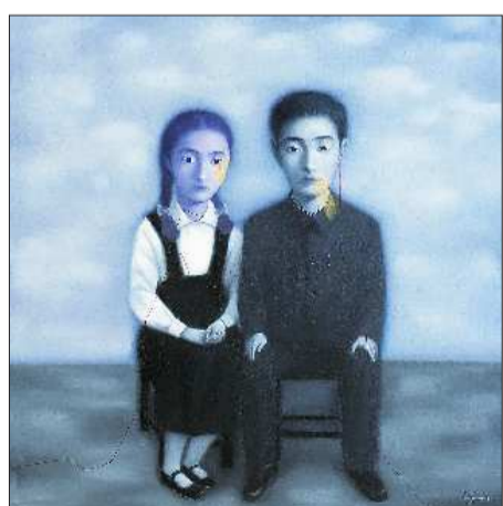
▲血缘大家庭系列作品之一