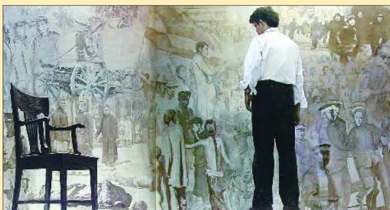
▲陈逸飞 《踱步》以4043.2万元拍出

而就当代艺术品而言,尤伦斯夫妇的获利也相当丰厚。因为尤伦斯夫妇不仅是最早在中国内地投资当代艺术品的国际收藏家,而且他们超前敏锐的嗅觉还让他们以相对便宜的价格就轻易收藏到了众多像陈逸飞、曾梵志、张晓刚、方力钧等人的作品。然而,近几年当代艺术品在国内迅速升温,也令尤伦斯夫妇获得了巨大的投资回报。据公开的数据显示,从2009年以来,在拍卖场上推出尤伦斯夫妇收藏的中国当代艺术品,成交价多在几百万元至数千万元之间。像在2009年春拍上,陈逸飞1979年作《踱步》,最终成交价高达4043.2万元;张晓刚2001年作的《血缘大家庭系列》也以1680万元被藏家买走。 本报记者 张向阳