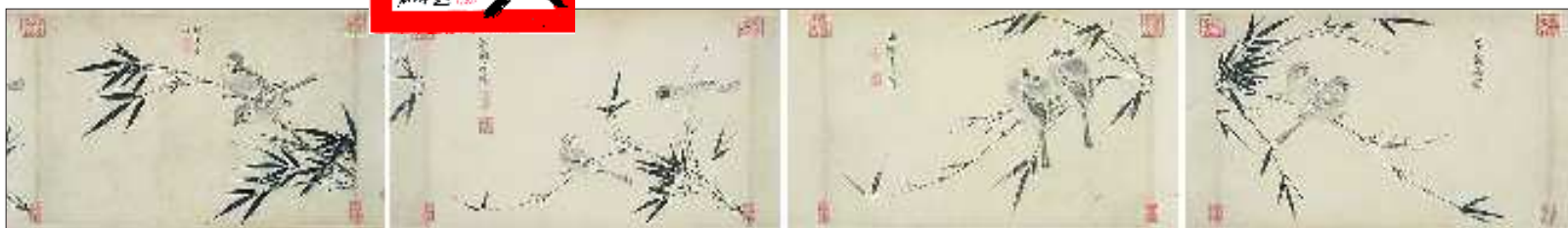
▲宋徽宗 《写生珍禽图》以6171.2万拍出