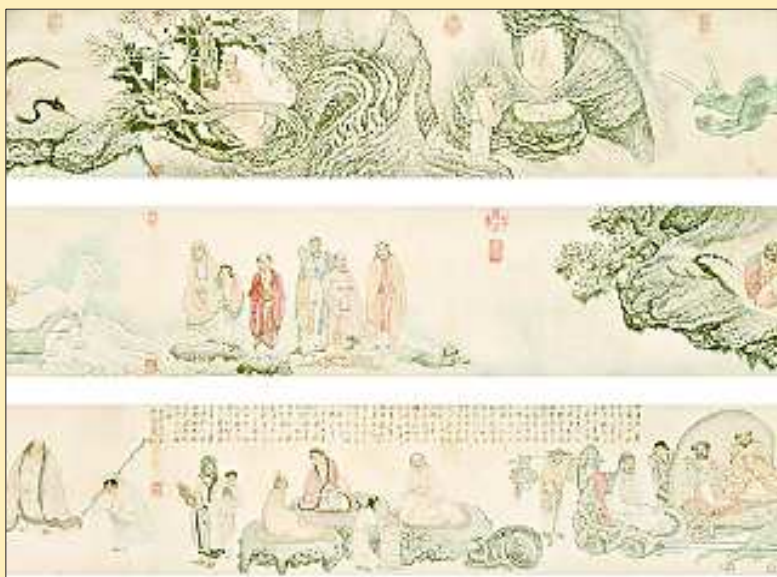
▲《十八应真图卷》以1.69亿拍出