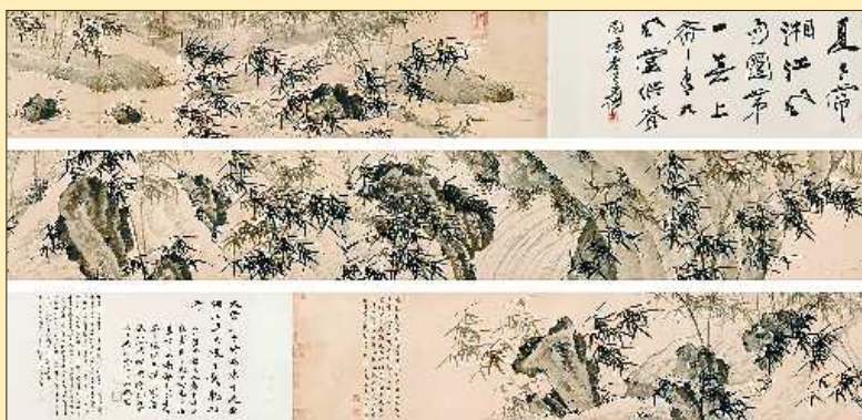
▲夏昶 《湘江竹石图》(手卷)拍出5936万元