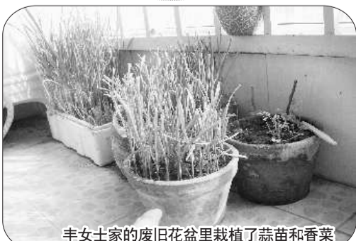
丰女士家的废旧花盆里栽植了蒜苗和香菜

网友“爱无止境”对这些废旧花盆也有妙用。把一些稍大一点的花盆刷洗干净,用来储存大米,小米等物品,不仅可以节约空间,还能防潮、防蛀虫。