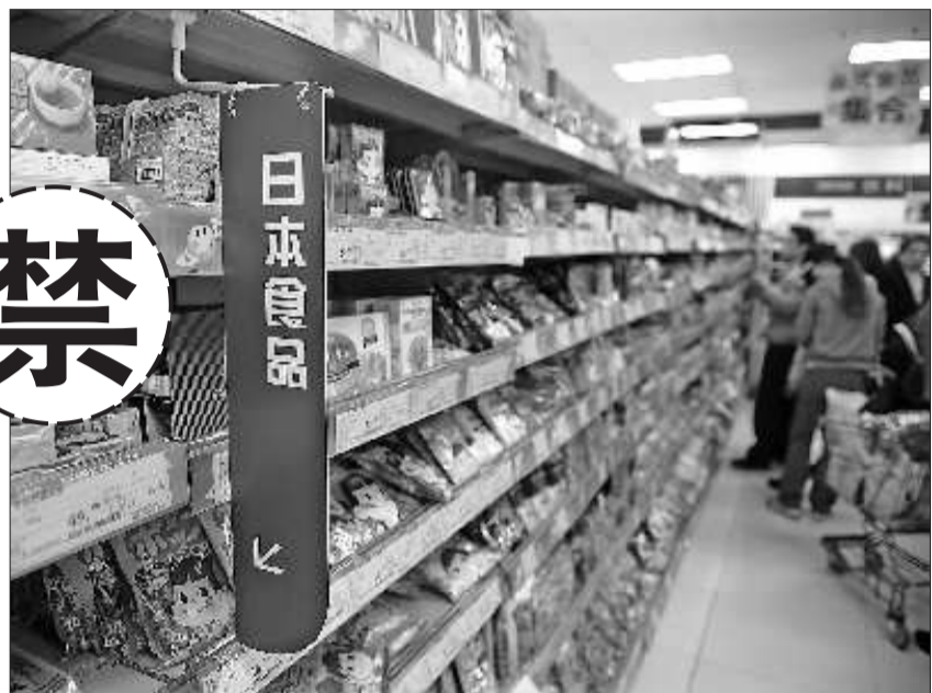
3月21日,青岛一超市工作人员在日本食品销售专区整理货架。

本报讯 3月24日,国家质检总局发布公告,禁止部分日本食品农产品进口。质检总局表示,日本福岛核电站泄漏事故已对当地食品农产品造成严重污染,日本政府已从多个地区的有关食品农产品中检出放射性物质严重超标,并做出禁止流通和禁止食用的决定。 为确保输华食品农产品安全,质检总局公告要求:第一,自即日起,禁止进口日本福岛县、栃木县、群马县、茨城县、千叶县的乳品、蔬菜及其制品、水果、水生动物及水产品;第二,各地检验检疫机构要进一步加强日本福岛县、栃木县、群马县、茨城县、千叶县生产的其他输华食品农产品中放射性物质浓度的检测,防止受放射性污染食品农产品进口;第三,各地检验检疫机构要加强对日本其他地区生产的输华食品农产品中放射性物质浓度的监测和风险分析,确保日本输华食品农产品的质量安全。