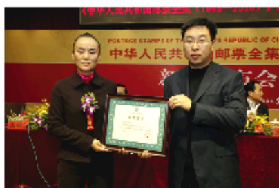
▲发布会上国家图书馆荣誉收藏《中华人民共和国珍邮全集》