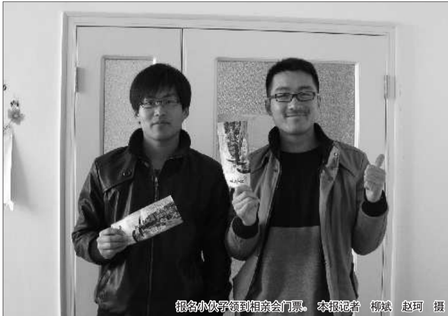
报名小伙子领到相亲会门票。

目前,主办方正在对报名者个人信息进行采集和校对,以确保在相亲会之前将每一个报名者的个人信息都准确无误地展现在大家面前。