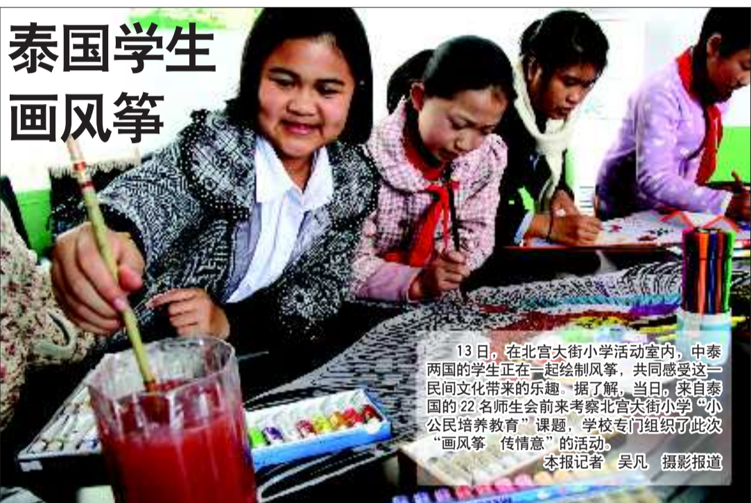
13日,在北宫大街小学活动室内,中泰两国的学生正在一起绘制风筝,共同感受这一民间文化带来的乐趣。据了解,当日,来自泰国的22名师生会前来考察北宫大街小学“小公民培养教育”课题,学校专门组织了此次“画风筝 传情意”的活动。