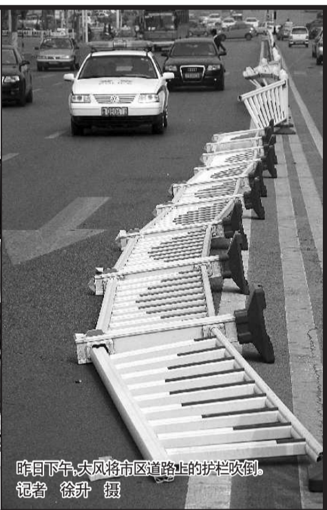
昨日下午,大风将市区道路上的护栏吹倒。