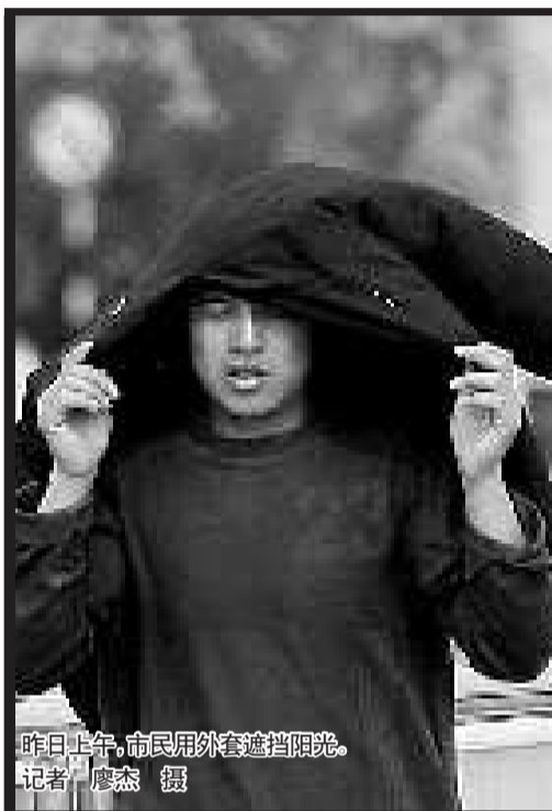
昨日上午,市民用外套遮挡阳光。

本报也开通了举报热线,欢迎市民举报各类违规食品生产加工黑窝点,报料电话:8966179。