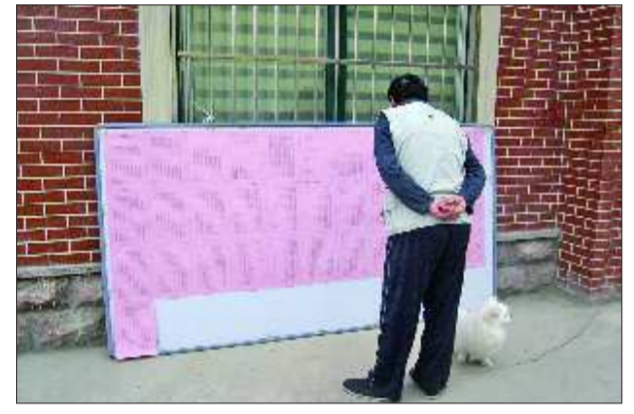
在有些社区，由于宣传不到位，相关选举情况关注度不是太高。

18日，居委会新提名和自荐候选人资格考试已进入尾声，天桥、槐荫、市中、历城已经先后举行完面试，历下区各个街道的面试也将于19日全部结束。回顾整个考试过程，记者采访到的考生们都谈到了，笔试、面试监考都很严，比较公平公正。 济南市民政局3月29日在官方网站上公布了“济南市第八届社区居委会新提名和自荐候选人资格考试简章”，不过，一些家住解放路附近的杜先生，