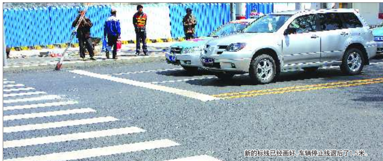
新的标线已经画好,车辆停止线退后了1.5米。

据了解,作为慢行示范路,玉兴路上道路两侧以及较大的路口处都将铺设彩色沥青。按照工程进度,玉兴路快车道20日能够通车,随后进入慢行一体的收尾工作。