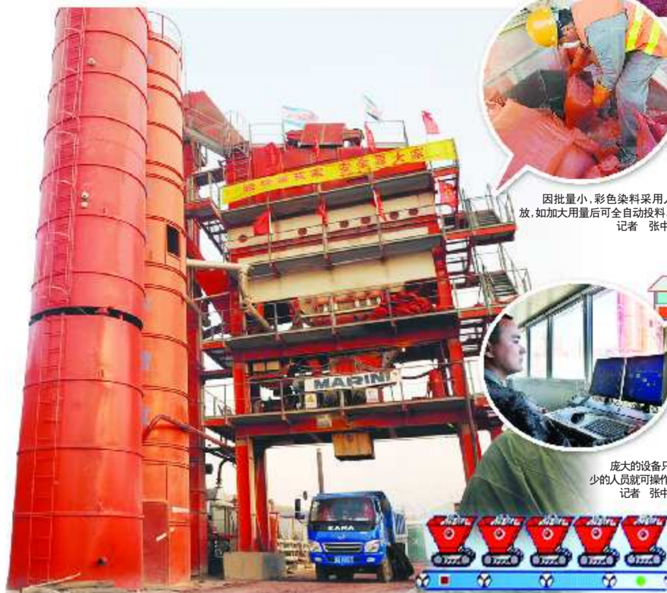
彩色沥青出料时温度在160℃至180℃之间。

据了解,现在的彩色沥青有红、蓝、黄、绿等多种颜色,而文化西路选择铁红色沥青料,主要是因为铁红色比较鲜艳,给人的视觉冲击力强,从而发挥交通诱导功能。另外,红色沥青混凝土耐久性要强一些。