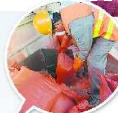
因批量小,彩色染料采用人工投放,如加大用量后可全自动投放。