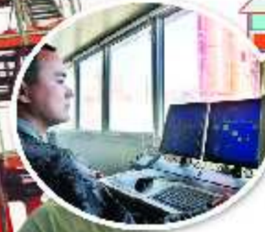
庞大的设备只需很少的人员就可操作。