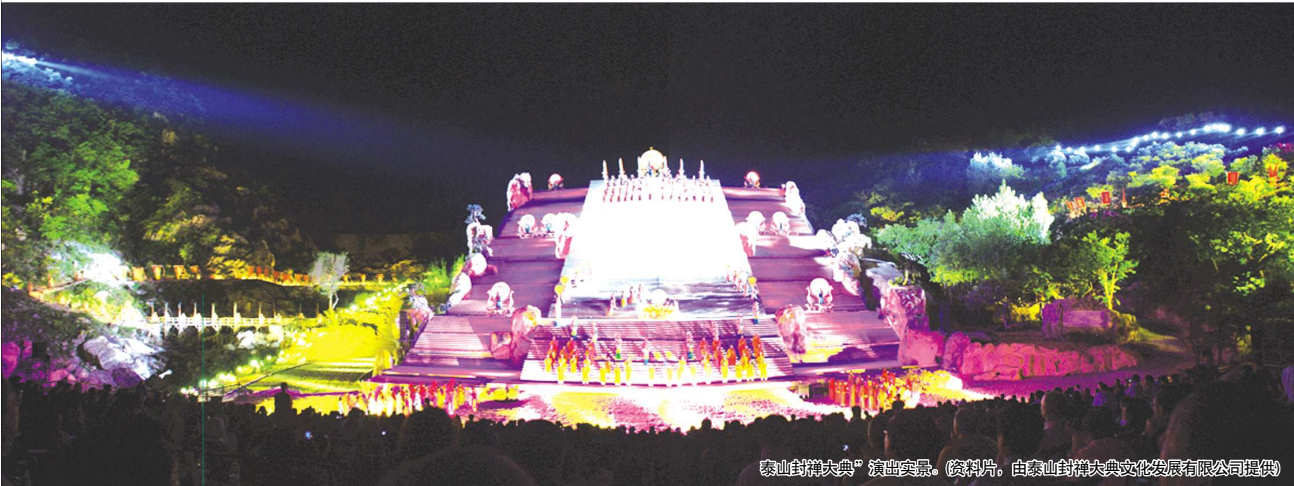
泰山封禅大典”演出实景。

借齐鲁晚报·今日泰山三岁生日之际,我谨代表泰山封禅大典文化发展有限公司全体工作人员,祝愿今日泰山越办越好,继续谱写辉煌篇章!