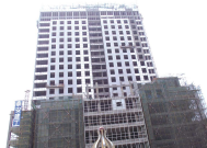
泰安市中医医院新病房楼。(资料片)

三年来,泰安市医疗卫生事业突飞猛进。基本药物制度的实施,城镇居民档案逐步完善,驻泰医院电子病历推行,各大医院软件和硬件设施长足发展。泰安市民正在享受着医疗改革和医疗水平提升之后的种种实惠。