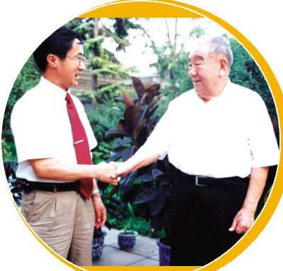
原全国人大常委会副委员长布赫亲切接见李一杰校长。