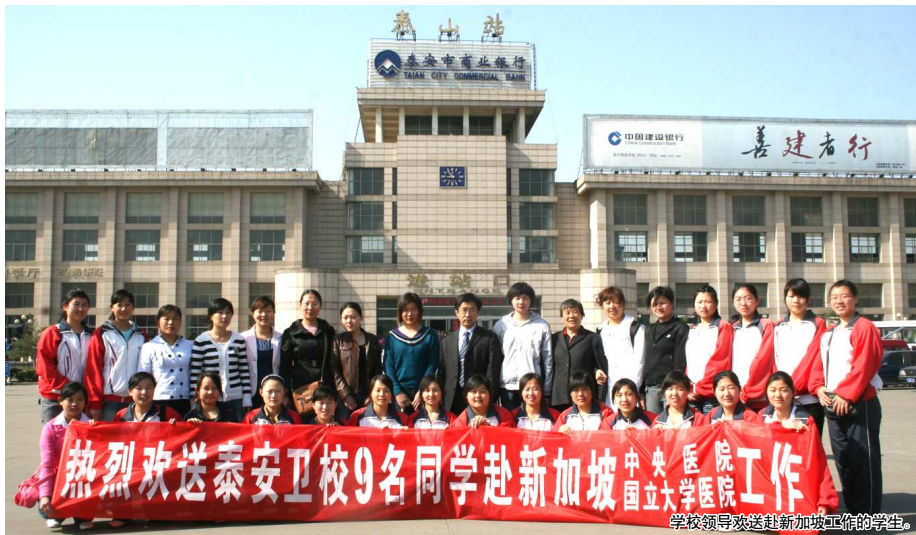
学校领导欢送赴新加坡工作的学生。

3月11日,山东省人民政府正式下文批准山东省泰安卫生学校正式升格为泰山护理职业学院。在学校升格中,泰安卫生学校是全票通过,并且是唯一独立升格的学校。这意味着,泰安卫生学校实现了凤凰涅槃,在前进的道路上又实现了崭新的跨越。