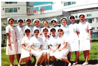
在解放军第二炮兵医院工作的部分学生合影。