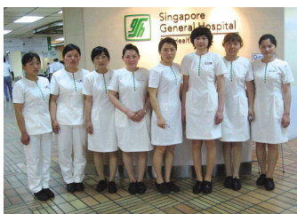
在新加坡工作的部分学生合影。

春风沐雨五十五载,往事悠悠宛如春歌。泰山护理职业学院的设立,是泰卫人的一份喜悦,一种荣耀,更是一份激情,一种责任。泰卫人在不懈的拼搏奋斗中终于找回本应属于自己的那份自信,实现了当初想都不敢想的历史性跨越,高昂起了卫生职业教育的龙头!这是凝聚的功能,这是搏击的效应,这是科学发展带给泰卫人的一份厚重的礼物!今天的泰卫人,正承载着新的希望,驾驭着历史的机遇,驶向新的彼岸,创造新的辉煌!