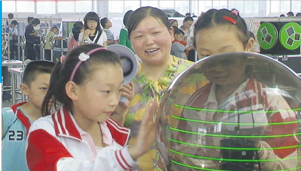
肥城市流动科技馆走进乡村(徐鹤江)