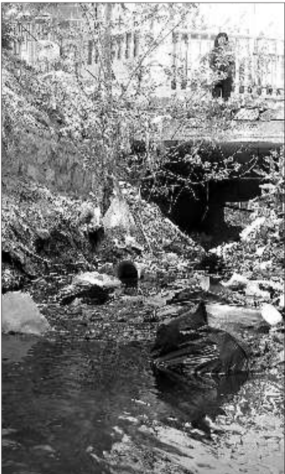
◀污水颜色如墨汁一般,不时散发出臭味。