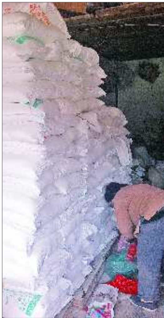
在七里堡市场内的一些粮油专卖店内,还存有少量含有增白剂的面粉。

在采访中,还有几位粮油店老板称,由于是存货,“增白”面粉一袋价格在70元左右,而不含增白剂的一些面粉要近80元一袋,这也吸引了不少人来购买“增白”面粉。