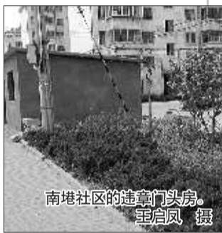
南港社区的违章门头房。

本报5月4日讯(记者 鞠平 实习生 王启凤) 绿化带本是美化环境、减少污染的城市风景带,不料却被某些市民盯上,将绿树红花移走,盖上水泥平房。5月4日,在莱山区南港社区,记者看到这样一幕。