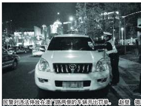
民警对违法停放在澳门路两侧的车辆开出罚单。

据统计,4日晚1个小时内,澳门路百丽广场和海信广场附近路段就有30辆车因为违法停车受处罚。