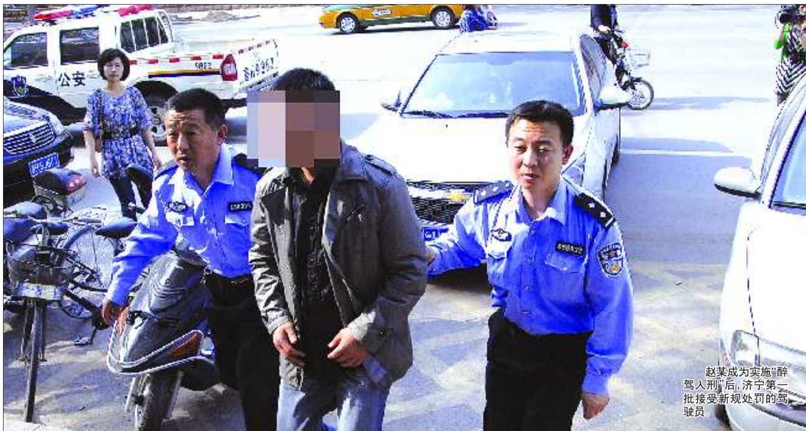
赵某成为实施“醉驾入刑”后, 济宁第一批接受新规处罚的驾驶员。