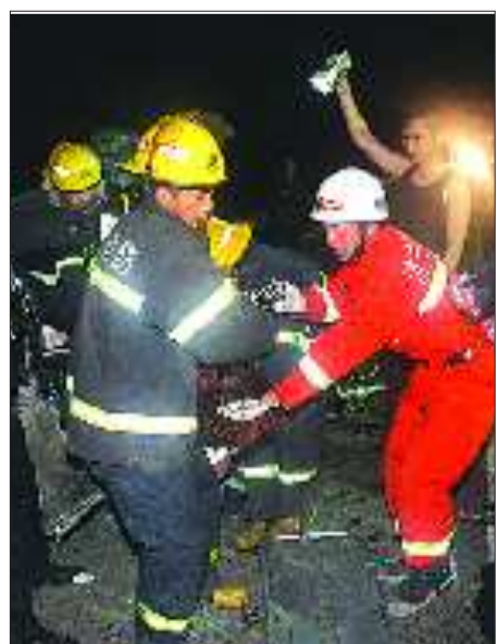
事故现场。

5日下午, 记者从济宁市第二人民医院获悉, 目前其中2名伤者的生命体征稳定, 另外一名伤者的情况尚不明朗。