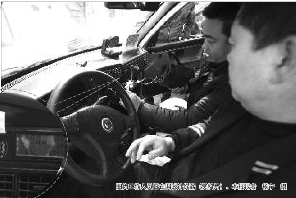
图为工作人员正在调试计价器(资料片)。

去年6月,青岛推出出租车刷卡交费业务,手持琴岛通,可在岛城千辆海博出租车进行刷卡付费。5日,记者了解到,一年来,刷卡乘车的市民逐渐增多,但可以刷卡付费的出租车数量却止步不前,街头目前仅一成出租可刷卡,市民打车想刷卡不得不挑车。