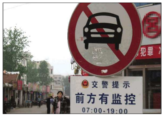
标志牌变回“19:00”,白底蓝字更清晰。

本报聊城5月9日讯(记者 刘云菲)4日,本报以《限时牌的19:00昨改成9:00 抹掉一个“1”坑了不少司机》为题,报道了益民胡同限时牌上的“19:00”,被抹掉一个“1”。9日,该限时牌焕然一新,“9:00”变回了“19:00”。