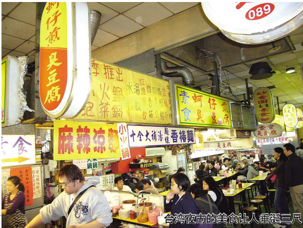
台湾夜市的美食让人垂涎三尺

秒杀产品:沂水地下大峡谷、萤光湖一日游 正常报价:170元/人 秒杀价:0元 名额:5名 沂水地下大峡谷是我国特大型溶洞之一,也是目前江北第一长洞。尤其是洞中有一条碧水流长的地下暗河,在我国北方实属罕见。地下萤光湖:湖光山色、星际梦幻、黑洞探秘、幽谷星河、穿越时空等5个景区60余处景点。 服务标准: 1、用车:全程空调旅游车 2、门票:景点第一门票(不含漂流50元/人) 3、导游:全程专职导游服务 4、保险:旅行社责任险