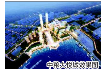
中粮大悦城效果图

中粮集团开发的芝罘湾片区“中粮大悦城”西至海港路,东至胜利路,南至北马路,北至海滨。这里将建五星级酒店、高级办公楼、公寓住宅和商业设施。项目分两期实施,一期地块西至海港路,东至西南河路,南至北马路,北至用地边界。港