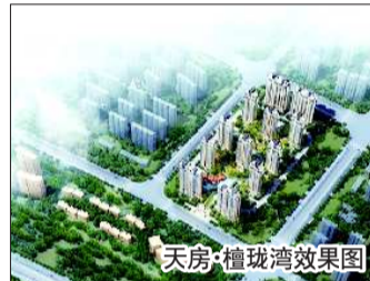
天房·檀珑湾效果图

檀珑湾项目总占地面积10万m 2 ,建筑面积29万m 2 ,住宅建筑面积22万m 2 ;总户数1852户,规划停车位2778个,主力户型为85~95m 2 两居,110~140m 2 三居。在户型设计上,充分考虑山、海景观价值和日照采光通风等原则,做到户户有景、户户朝阳、全明厨卫、套型方正,使用率高达85%以上。社区由8幢独栋、4幢联体低密度居所和16