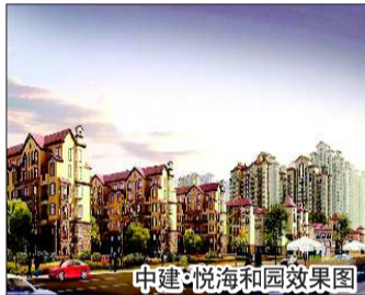
中建·悦海和园效果图

中建·悦海和园位于烟台开发区西部——区域副中心,总建筑面积67万平方米,项目东北临海滨路,东南为白银河景观公园,西北侧为南京大街,东北侧为烟台西部的门户之路——206国道。项目交通十分便利,距规划建设中的潮水机场15分钟车程,城市内外,畅行通达。项目临近滨海金沙滩和白银河景观带,并靠近磁山风景区,景观资源十分丰富,为烟台少有的占据千米黄金海岸线与河滨公园双向景观带的高品质社区。