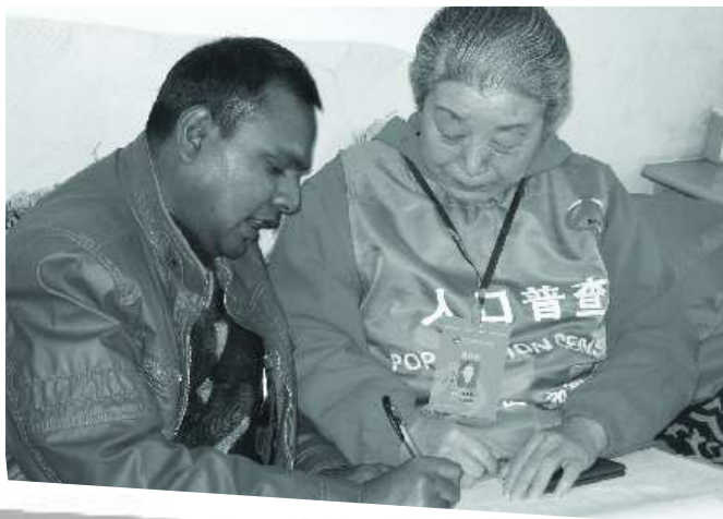
普查员正在进行人口普查。(资料片)