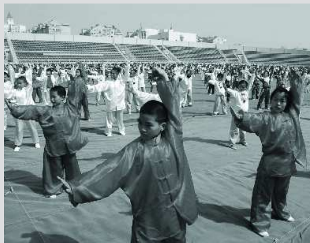
14岁以下人口比重下降。(资料片)

按照全市统一部署,到2012年,青岛市将实现城乡新增机构养老床位1.2万张,床位总数3.3万张,千名老人拥有养老床位23张;享受政府购买居家养老服务的困难老年人1万人;市内四区社区普遍建有“社区日间照料中心”或“社区老年人娱乐室”,在自愿独居的老年人家中设立“社区养老互助点”4000个;三区五市镇(街道)普遍建有老年人服务中心,90%农村社区拥有老年人活动场所。