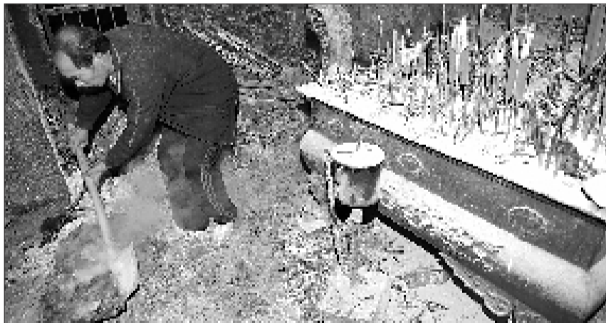
里,隔离易燃物。着火时养蜂人张洪泉从铁栏杆上爬进殿。