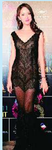
出席中国之夜晚宴红毯时,张梓琳穿着一袭黑色蕾丝透视礼服,深V领和裹身的裙摆让她看上去像一尾黑色的美人鱼,相当抢眼,不愧是世界小姐出身。