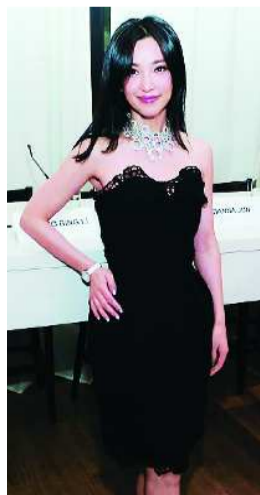
《雪花秘扇》见面会活动时,李冰冰的小礼服比较简洁,面料比较有亮点,而且适合室内的酒会和活动,既正式又不拘谨,显得有自信。