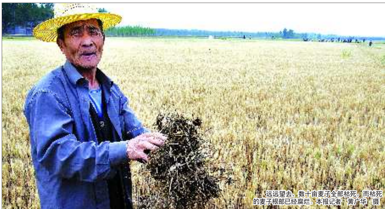
远远望去,数十亩麦子全部枯死,而枯死的麦子根部已经腐烂。