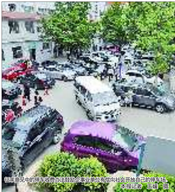
征求意见中的停车收费办法鼓励企事业单位有偿向社会开放自己的停车场。