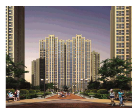
绿地新里卢浮公馆