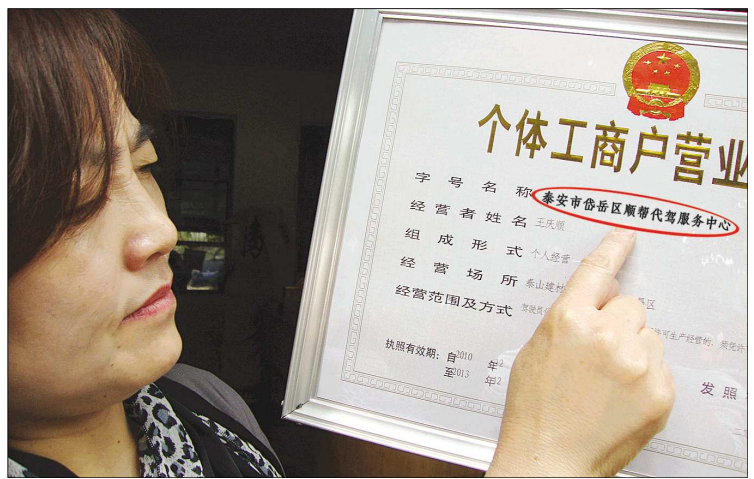
从工商局就能办出代驾营业执照。