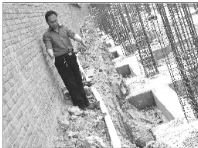
▶施工地基离居民楼东墙只有1.6米。