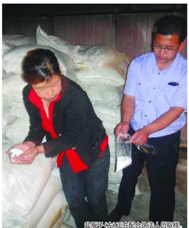
盐贩子(左)正在配合执法人员取样。

成搅拌站的建筑工人靠近大院,并确定了该私盐仓库的具体位置。“仓库有两道门,每道门从门锁到门缝都用黑胶皮封盖。”祝鲁红支队长说,从外面根本看不出里面装的是什么东西,更别说周围居民了。