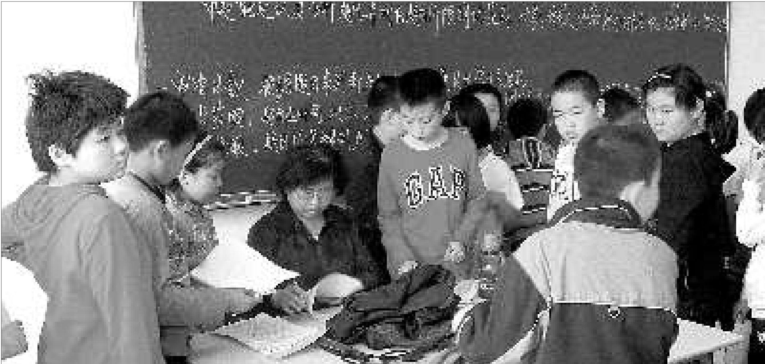
▲5月22日下午,在济南市青少年宫作文培训班上,老师在给学生们批改作文。