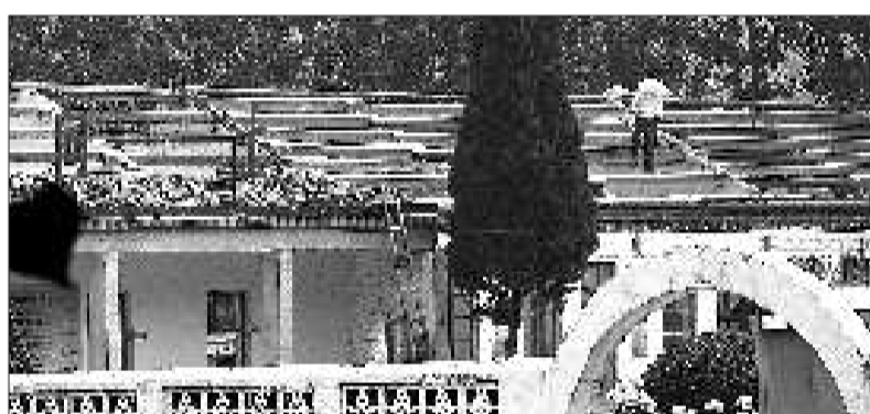
学校的教室房顶正在维修。