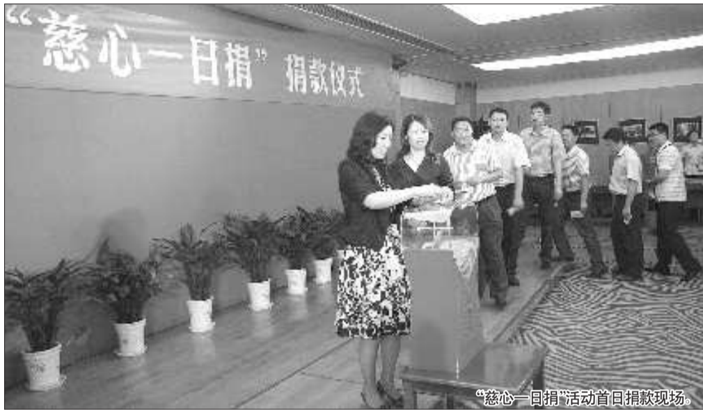
“慈心一日捐”活动首日捐款现场。

本报威海6月8日讯(记者 许君丽) 8日上午,威海市2011年“慈心一日捐”活动正式启动。启动仪式上,山东家家悦超市有限公司、山东威高集团等爱心企业和个人代表现场捐赠善款1659.8万元,这些款项今后将全部用于慈善救助活动。仪式后,威海市民政局系统干部职工现场捐款12600元。 “慈心一日捐”是经省政府批准,在全省范围内每年开展一次的善款募集活动,募集的资金主要用于救助当地困难群众。自2004年以来,通过开展“慈心一日捐”等活动,威海市共募集善款5.9亿元,通过实施慈善“助医”、“助学”、“助