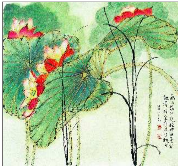
▶静观荷塘如悟禅 ▲满纸红云当笑歌