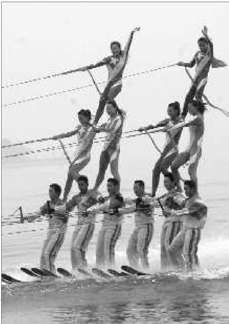
中国队上演“叠罗汉”。

临沂水资源丰富,目前城区已形成水面50平方公里,这也是临沂举办滑水赛事的原因之一。除了此次中美澳艺术滑水对抗赛,临沂还将于今年9月21日至26日承办世界杯滑水赛,该赛事是国际滑水联合会组织的国际A级赛事,参赛选手为全球排名前20位且拥有世界冠军头衔的顶尖滑水高手。相比艺术滑水注重表演而言,世界杯赛将更注重竞技性。