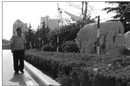
风筝广场上,保安人员正在巡查,旁边便是新安装的围栏。