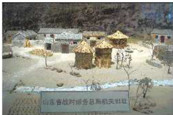
山东省战时邮务总局机关旧址