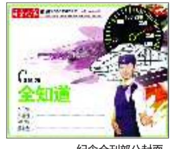
纪念金刊部分封面。