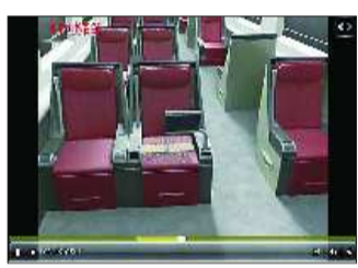
“京沪高铁全媒全景”视频截图。

本报济南6月29日讯(记者高扩) 鼠标轻点遍识车内机关,长卷漫展静赏窗外美景。随着京沪高铁的开通,本报京沪高铁报道也是高潮不断。30日,本报精心打造的“京沪高铁全媒全景”将在齐鲁晚报网惊艳上线。 广大读者和网友可以访问齐鲁晚报网(www.qlwb.com.cn),点击齐鲁晚报京沪高铁专题报道