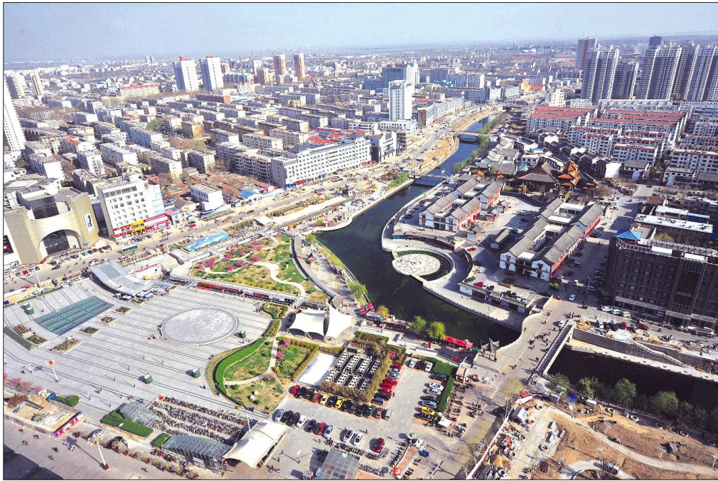
俯瞰济宁城区。(资料片)

在产业链延伸上，围绕“吃、住、行、游、购、娱”六要素，加快接待、餐饮设施建设和文化演艺产业发展。着眼扩大接待容量、提升档次水平，合理布局建设高档接待场所，加快在建星级酒店进度，完善现有宾馆、饭店服务功能，积极引进各类品牌连锁酒店，切实满足游客食宿需求。以增加综合购物、休闲、娱乐及夜生活项目为着力点，规划建设一批高档商城、会所、歌舞厅、健身中心等场所，