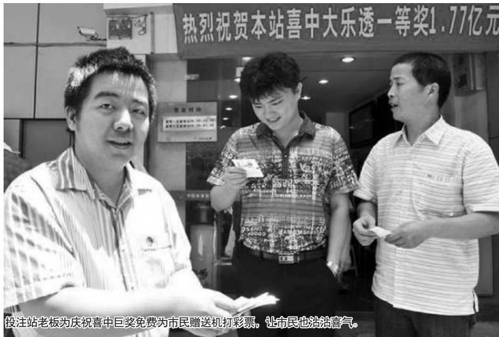
投注站老板为庆祝喜中巨奖免费为市民赠送机打彩票，让市民也沾沾喜气。

有人中了大乐透1.769亿元的惊天巨奖？没错！重庆江北区02818体彩投注站中出了第11074期大乐透21注一等奖，一等奖奖金共计1.769亿元！同时，这也刷新了长寿彩民2008年创下的一人独中大乐透8234万元的纪录，中国体彩新的巨奖纪录由此诞生！