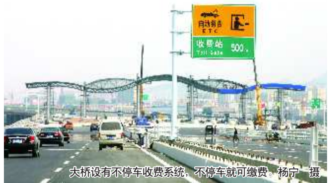
大桥设有不停车收费系统,不停车就可缴费。

也许有人会觉得凌驾于海面之上,有海风降温,跨海大桥路面温度不会太高。事实上,桥面温度往往比普通道路要高出2℃到3℃,这对高速行驶的车胎也是个考验。本报提醒市民,出发之前务必仔细检查车胎是否老化、胎压是否正常,避免行驶中突然爆胎。