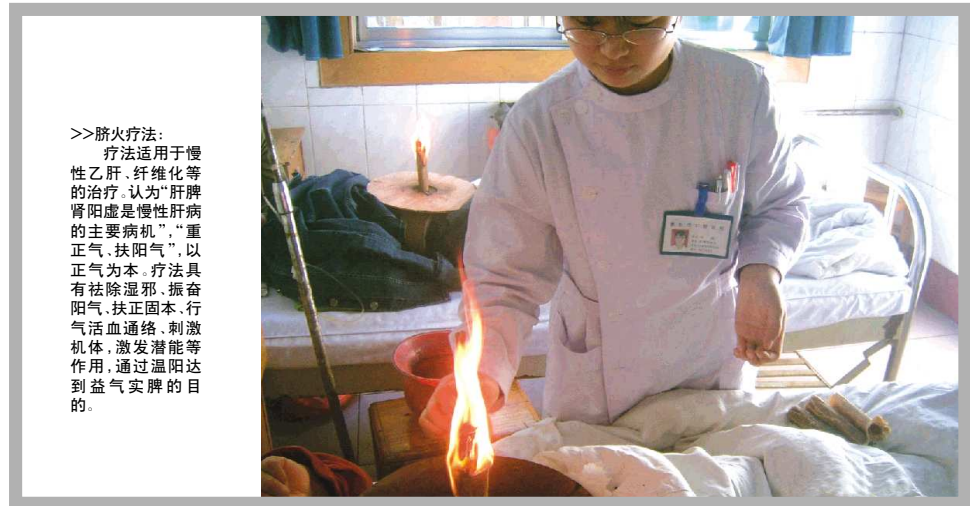
>>脐灸疗法: 疗法适用于慢性乙肝、纤维化等的治疗,认为“脾肾阳虚是慢性肝病的主要病机”,“重正气、扶阳气”,以正气为本。疗法具有祛除湿邪、振奋阳气、扶正固本、行气活血通络、刺激机体、激发潜能等作用,通过温阳达到益气健脾的目的。

象,省十届人大代表,省十大廉洁行医标兵,获得山东省“富民兴鲁”奖章,“山东省名中医”,第四批“全国名老中医”学术继承人指导老师。中心始终坚持“以病人为中心,以质量为核心”的服务宗旨,关爱患者的生命健康,坚持科技兴战略,全心全意为患者服务。在广大患者中的知名度不断升高,成为泰安地区肝病患者的首选诊疗单位,同时外埠患者就诊率显著增加,达到30%以上。内蒙古、新疆、江苏、湖北等全国各地均有来诊患者,得到广大患者的高度认可,每年均收到大量患者的感谢信及锦旗。山东电视台、泰安电视台、齐鲁晚报、泰安日报、泰安晨报等媒体给予了多次报道及高度评价。 地址:泰安市中医医院肝病治疗中心,泰安市迎大街216号,市内乘1、4、11、33路车直达。 电话:6111441、6122959 E-mail: taishangbz@126.com